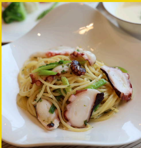
タコと九条ネギの ペペロンチーノ

旬の地元産タコの旨味とシャキシャキとした九条ネギの触感をペペロンチーノでお楽しみください。