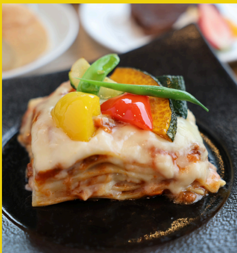
夏野菜のミートラザーニア (1日 限定12食)

早い者勝ち！見た目も綺麗なシェフ特製のとろーり熱々でジューシーなミートラザーニアです。