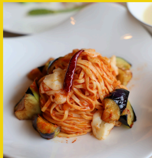
茄子とモッツアレラの ピリ辛トマトソース